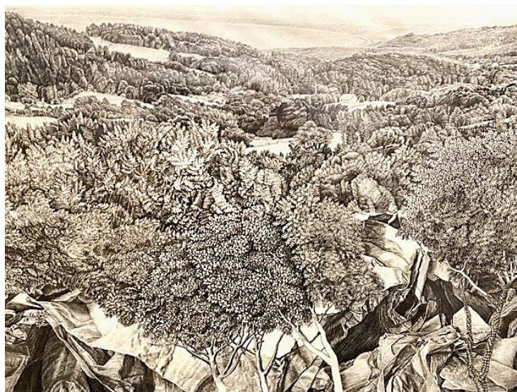
Bild: Man måste gå riktigt nära för att kunna se detaljerna som intill millimetern återger bland annat det halländska landskapet vid Båstad i vars närhet han har en ateljé. (första rummet)